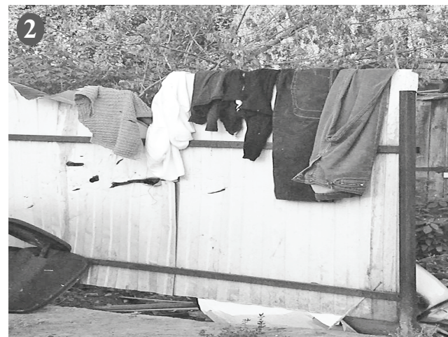
Фото и информация предоставлены администрацией ГП «Поселок Думиничи».