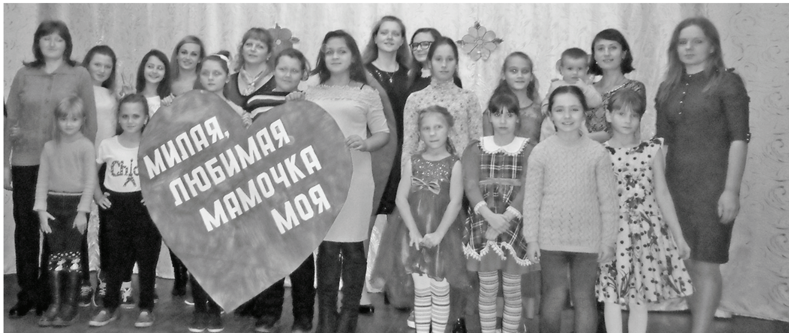
И в Паликовском СДК праздник удался на славу.