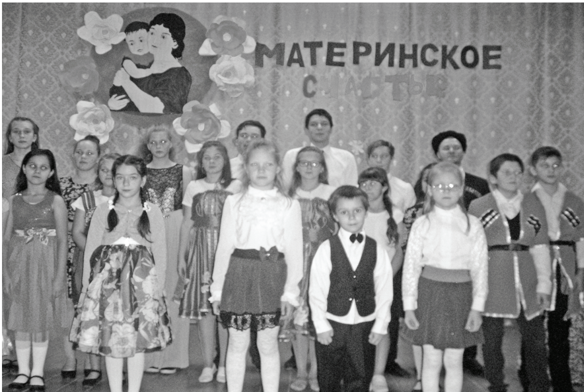
Юные артисты Паликовского СДК: с любовью - мамам и бабушкам.